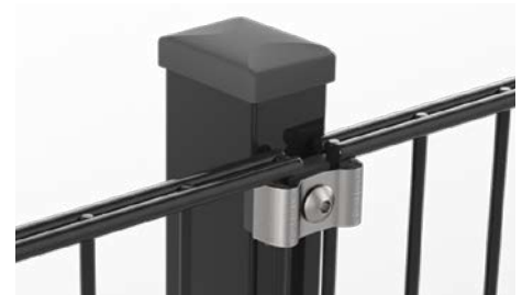
RANKO Multipfahl mit Klemmplatten mit langen Schenkeln