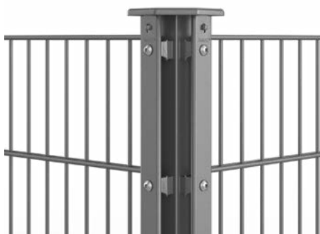
RANKO Profilschienenneckpfahl, für Ecken im Winkel von ca. 90°

Entsprechen den hohen Anforderungen der GUUV*