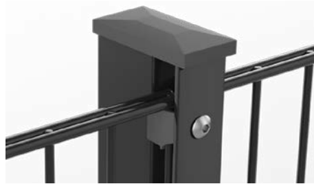
RANKO Multipfahl mit Flacheisen und Kappe mit Überstand