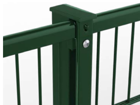
RANKO Profilschienenpfahl, vollständig aus Metall, hier mit Handlauf U-Profil auf der Doppelstabmatte