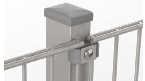
RANKO Multipfahl mit Flachklemmplatten