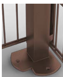
Eckpfahl mit Bodenplatte