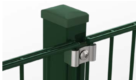
RANKO Multipfahl mit Klemmplatten mit kurzen Schenkeln