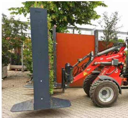
Die Mobile Gabione kann mit Stapler, Radlader oder Hubwagen transportiert werden.