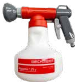
Birchmeier Aquamix Dünger-Spritze