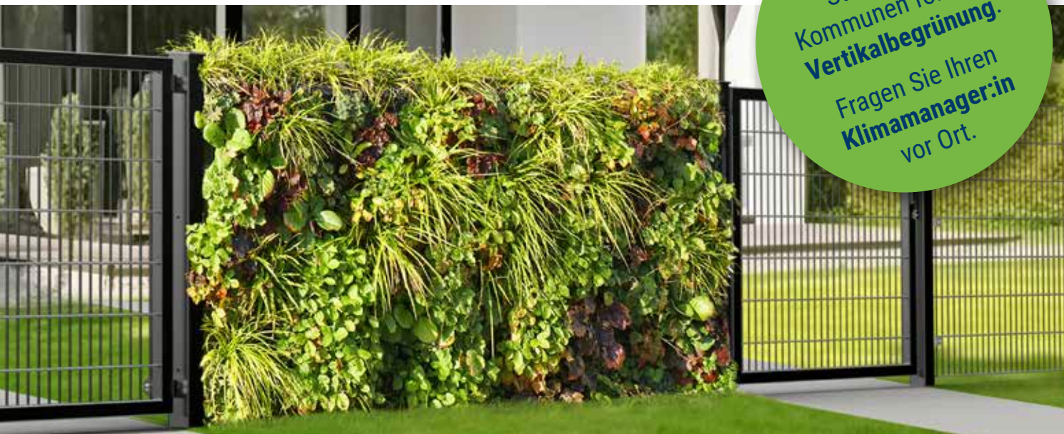
Die RANKO Pflanzen-Gabione macht auch in jedem Zaunverlauf eine gute Figur.

Viele Städte und Kommunen fördern Vertikalbegrünung . Fragen Sie Ihren Klimamanager:in vor Ort.