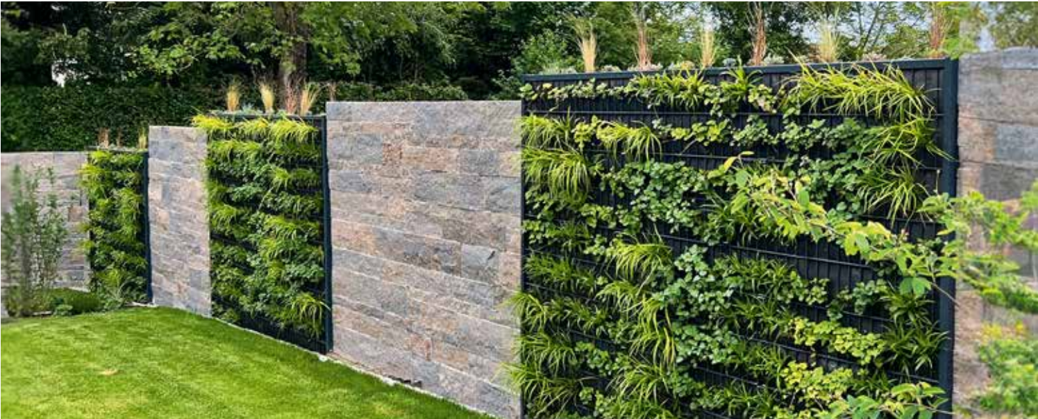
Die RANKO Pflanzen-Gabione gibt es mit ein- und beidseitiger Bepflanzung (Tiefe ca. 20 cm bzw. 30 cm).