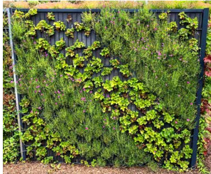
Wachstums-Plus: tolle Ergebnisse schon nach ca. 2 Monaten