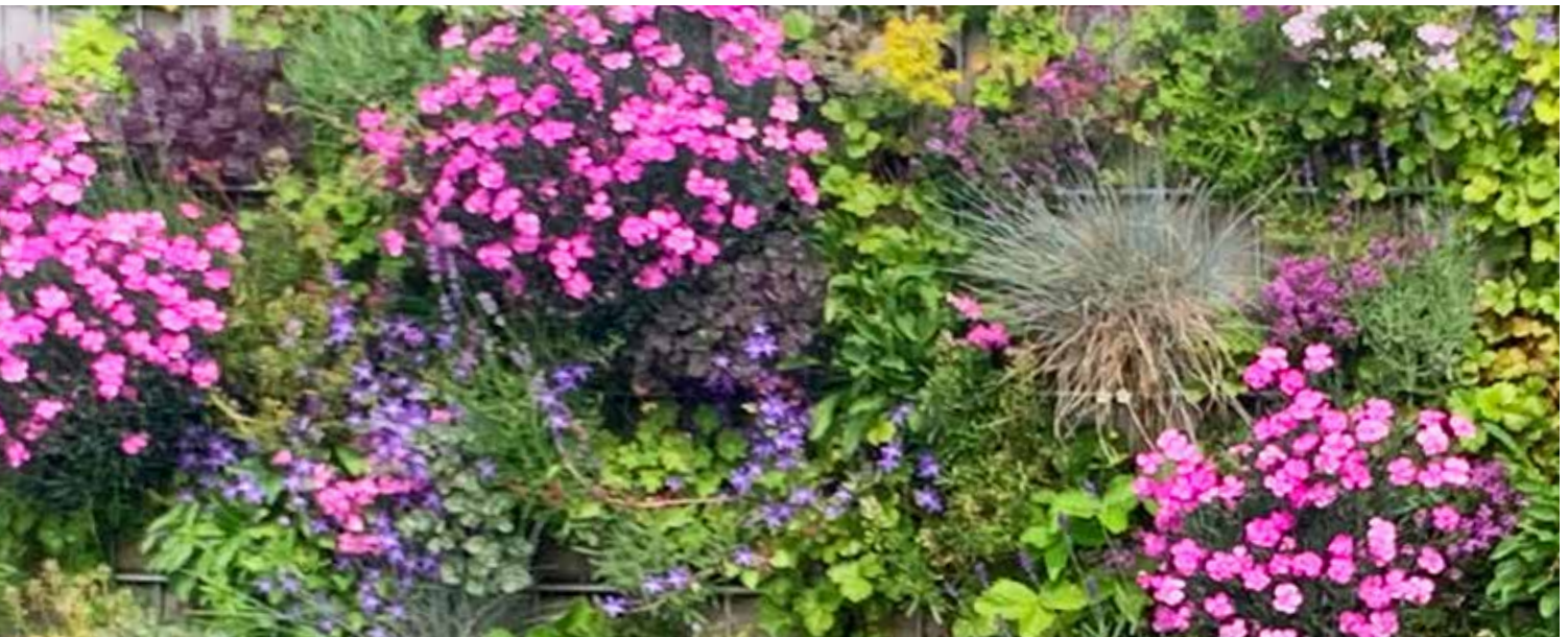
Die RANKO Pflanzen-Gabione – die Pflanzenvielfalt lässt keine Wünsche offen.