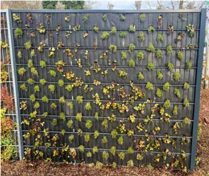
Frisch bepflanzt bereits ein stilvoller Schall- und Sichtschutz