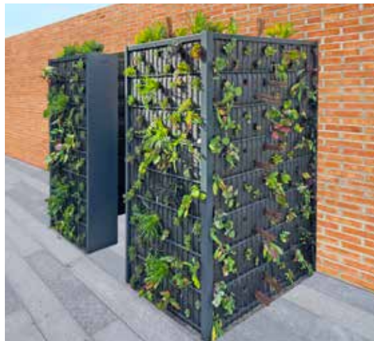
Ästhetik mit Funktion: Eck-Gabionen mit Eckelementen